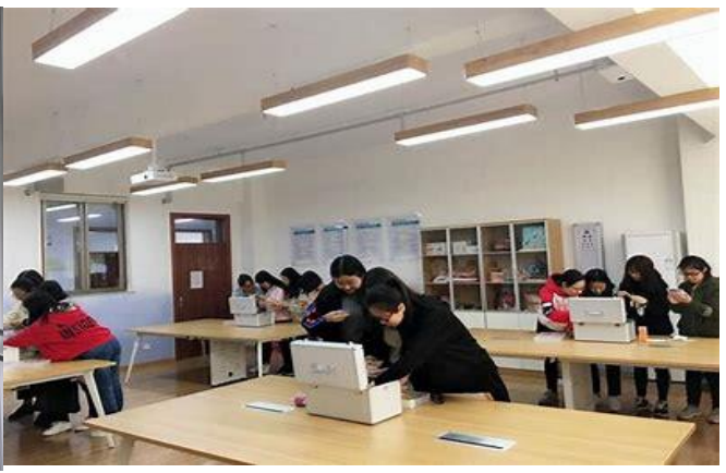
图4. 心理咨询实训室