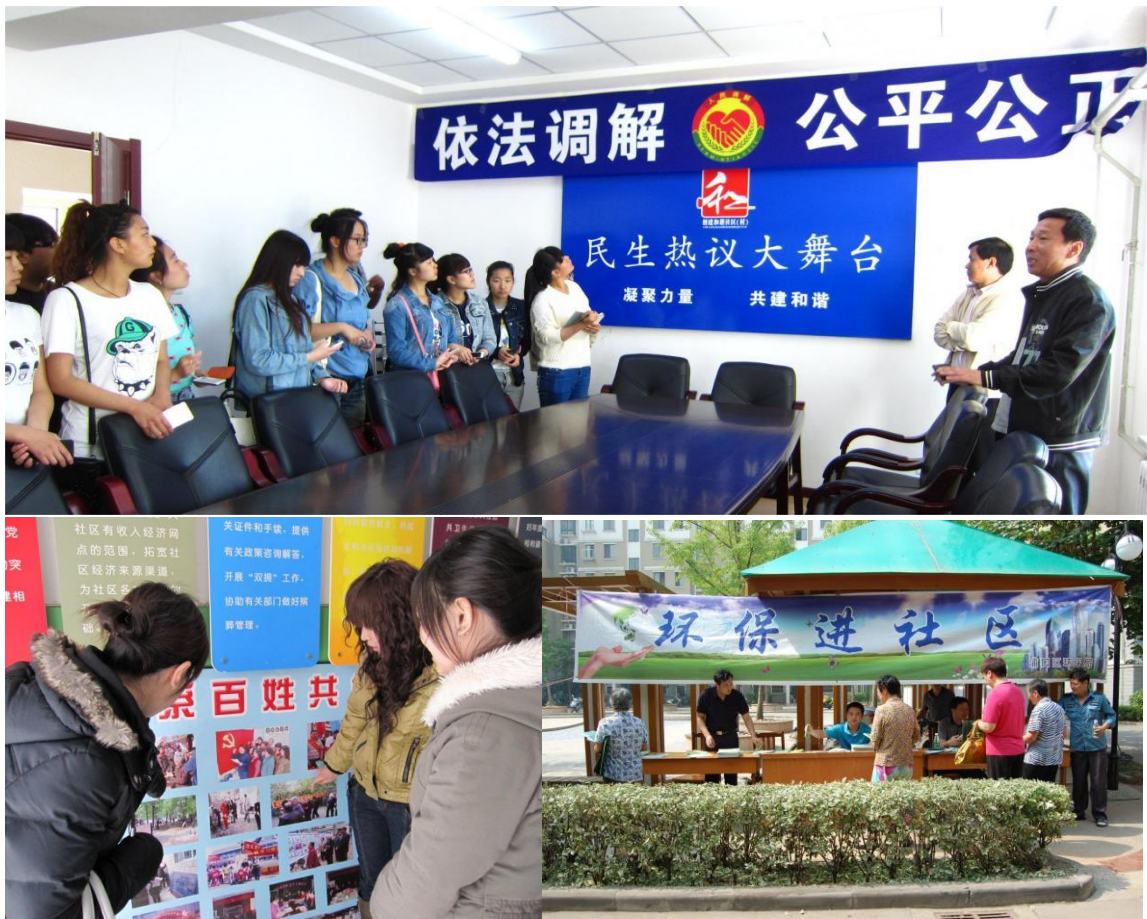
图10. 学生到社区实习实训