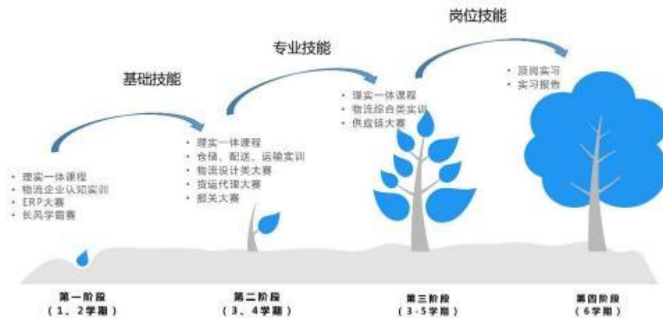
图2 “四阶段递进式”实践教学体系

2018 年-2020 年，本专业校企合作共同对人才培养方案进行修订，形成新的人才培养方案，根据其中的人才培养目标及规格，对实践教学体系进行重新调整和架构，创新形成物流管理专业“四阶段递进式”实践教学体系。全面落实新的实践教学内容，健全实践教学评价体系，提高学生的实践动手能力、专业技能和职业素养。