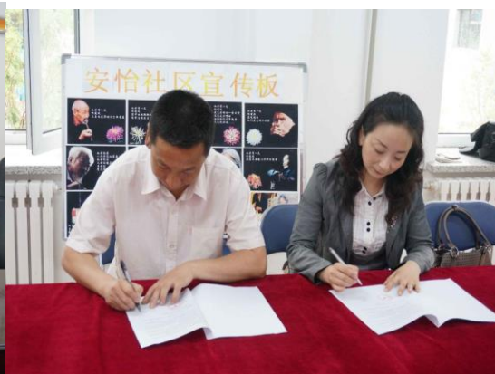
图9. 签订校企合作协议书