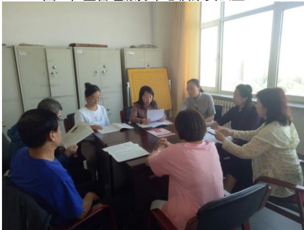
图5. 社区教研室教师开展教研活动