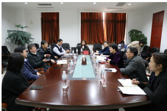
图7. 2021. 3. 23市民政局来访