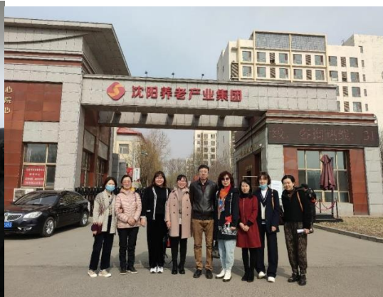
图8. 2022年4月到万佳宜康养老服务公司考察