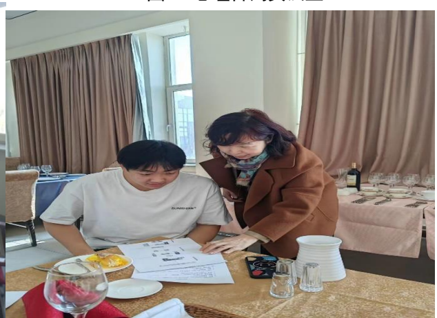
图6. 专业教师指导学生进行技能实践

社区管理服务中心模拟实训室的功能，是完全模仿社区工作的模式和流程而建设的，功能可分为社区综合业务接待服务区、社区热线服务区、社会心理访谈区、社区电子阅览室、社区居民心理诊疗区等。学校也可依托此实验室面向社会开发一些社会服务类的科研服务项目。社区工作模拟实训室是一个以教师讲授、学生进行角色扮演、案例分析和实习技巧训练为主要内容的一整套社区工作仿真模拟的工作平台。实验室既可承担教学实训任务，也可对外承接多种社会工作实务服务项目。“仿真社区工作软件系统”，含有民政、计生、社区工作者等模拟软件。学生通过“仿真社区工作软件系统”实训模拟训练，可以了解国家有关社会保障、社区工作等方面的政策法规，培养学生物业管理方面的操作技能，确保学生将来能胜任社区保障管理、社区服务管理、社区物业管理、家政服务公司管理人员等岗位工作，真正实现职业技术学院培养实际操作的实用性技能人才的目标。