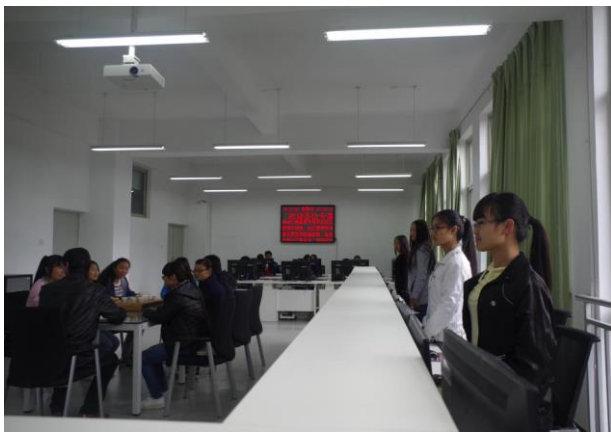
图3. 社区管理服务中心模拟实训室